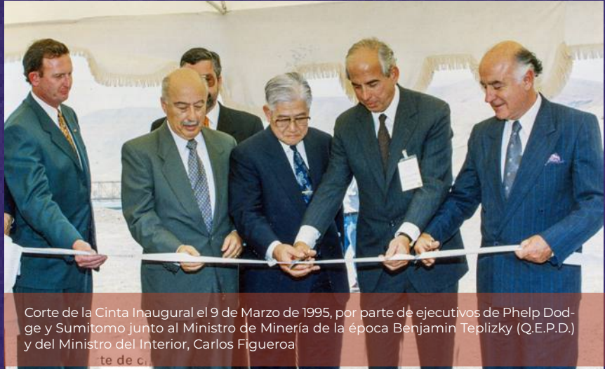
Corte de la Cinta Inaugural el 9 de Marzo de 1995, por parte de ejecutivos de Phelps Dodge y Sumitomo junto al Ministro de Minería de la época Benjamin Teplizky (Q.E.P.D.) y del Ministro del Interior, Carlos Figueroa

Desde su inauguración en 1995, la compañía se ha convertido en un eje impulsor de progreso para la zona. No solo produce cobre, sino que también ha contribuido de manera significativa a la economía local, generando empleos de calidad, desarrollando proveedores y realizando inversiones sociales que han transformado positivamente las