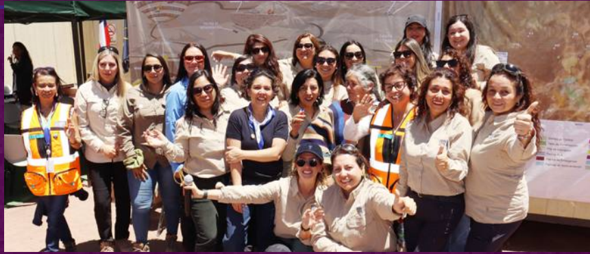
Ministra Aurora Williams, con parte del equipo de mujer en Fenix Gold