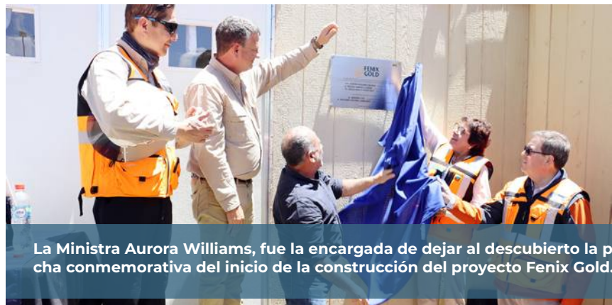
La Ministra Aurora Williams, fue la encargada de dejar al descubierto la plancha conmemorativa del inicio de la construcción del proyecto Fenix Gold.