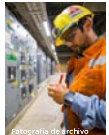
Fotografía de archivo