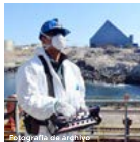
Fotografía de archivo