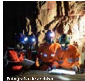
Fotografía de archivo