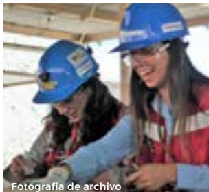
Fotografía de archivo

Av. Francisco Bilbao 1097-A Calama Chile Fono +56 (55) 2557479