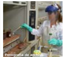
Fotografía de archivo

10 DE AGOSTO DE 2020 · DÍA DE LA MINERÍA