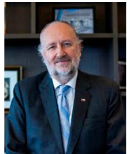
Baldo Prokurica, Ministro de Minería.

“Chile tiene una historia de ser un país serio, con reglas claras y permanentes. A esto se suman los profesionales de alto nivel y también la capacidad que tiene nuestra industria de trabajar unidos y en colaboración, tal como lo hemos visto ante esta emergencia sanitaria, donde las medidas implementadas tanto por los servicios de salud como por las empresas, han permitido mantener las operaciones funcionando con un número menor de trabajadores contagiados. Incluso, este sector ha sido el que menos impacto ha tenido con la propagación del coronavirus”.