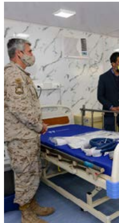
Entrega de Unidad Modular de Postoperatorio Ambulatorio

La compañía mantiene una coordinación permanente con autoridades y vecinos para contribuir a la región en tres ejes prioritarios: el fortalecimiento de la respuesta sanitaria, la implementación de los planes educativos de emergencia y el traspaso de capacidades y apoyo a las comunidades.